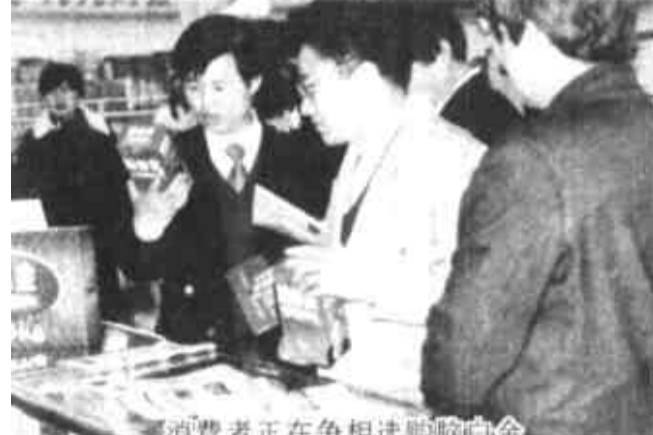
消费者正在争相抢购脑白金

近日东营街头巷尾，茶余饭后，大家议论最多是“脑白金”，这个位于大脑深处仅豆粒大小的核心器官，数月前老百姓尚很陌生，但今日已成为嘴边热门的话题。议论的内容最多的是： “脑白金在美国是白金的1026倍，中国人能消费的起吗？” “真得这么神奇，有效吗？” “东营有多少人已开始补充脑白金呢？” “东营人在补充脑白金后，结果满意吗？” “东营有脑白金出售吗？在哪？” 为了让大家不要盲目地将时间消耗在这些问题上，笔者走访了有关专家、医生、商场、批发站，询问相关答案，供参考： 1、脑白金的售价在美国曾高达每3毫克50美元，但那是二年前脑白金生产远远供不应求的时候。在全球已大规模生产的今天，中国老百姓完全可以消费得起。东营市场上十天剂量的脑白金大约每盒售价68元，每天消费仅6.8元，略低于营养品市场平均水平。该价位的产品是集胶囊和口服液于一体的最终定型产品，如果是过渡性产品，价格可能还要降低。 2、关于脑白金的效果，有的专家持肯定态度，但也有专家奉劝不要过分迷信。肯定的理由是：近十年来全球发表的数千篇论文，基本都肯定了补充脑白金的作用；发达国家最现实的消费者们为此赞赏；世界各大媒体大规模的报道；国内外大量动物和人体试验的功效验证；全球上亿使用者的赞颂。 提醒不要过分迷信的专家说法是：补充脑白金对根本改善人体器官作用不可否认。但让器官进入年轻状态，有的器官需要几个月，有的甚至需要几年的时间。器官已发生病变的患者，不可过分迷信脑白金，而放弃其它药物治疗手段。当然，对于患者，脑白金作为辅助治疗或根本性保健不失为一种方法。