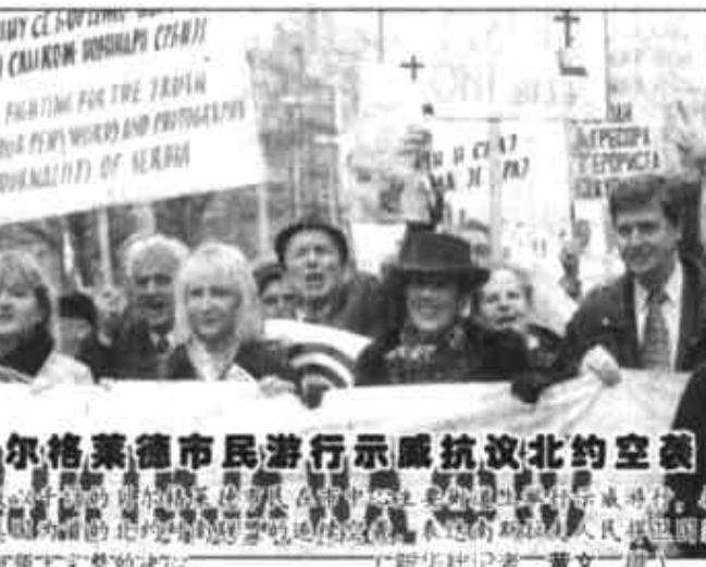
贝尔格莱德市民游行示威抗议北约空袭

新华社安卡拉3月31日电 土耳其外交部31日宣布，土耳其已经批准俄罗斯的申请，允许俄军舰通过博斯普鲁斯海峡前往地中海，以观察南斯拉夫局势。 土耳其外交部当天发表声明说，俄罗斯提出了关于从4月3日至8日8艘俄舰过境的要求，已经得到土耳其的批准。 与此同时，土耳其总理比伦·埃杰维特对俄罗斯此举表示关注。他说他对俄罗斯派遣舰艇前往地中海的决定感到“忧虑”，认为这将只会给予南联盟总统洛奇舍维奇以鼓励。 俄罗斯国防部长谢尔盖耶夫当天早些时候宣布，近期内将有7艘俄军舰前往南斯拉夫冲突地区，其中第一艘侦察舰将于4月2日驶离黑海基地。他说，目前巴尔干地区形势变幻莫测，北约正在加强军事力量，俄方“必须了解、分析该地区的局势并作出相应结论”。 美国国务院当天表示，美国对俄罗斯决定派军舰前往地中海一事表示关注。